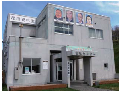
(写真上下ともに) 厚田資料室▶