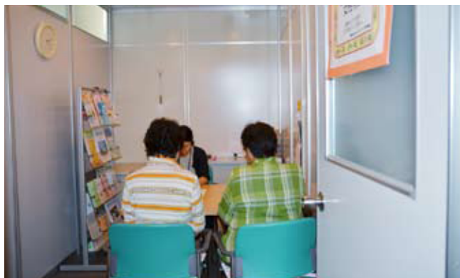
対面式相談の様子。電話での相談も可能です。