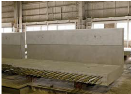
▲マンションのベランダ。壁に差し込めば出来上がり!