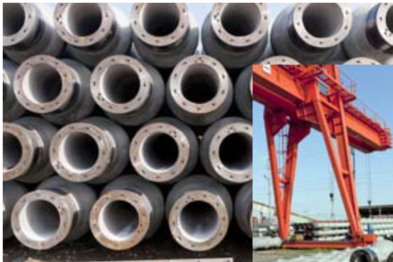
▲ホッコングループの一つ、ホッコンJP(株)では、マンションなどの高層建築物の基礎となるコンクリート製のパイル(杭)が製造されています。