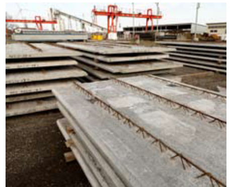
▲マンションの床。最終的には梁の上に乗せて、この上からコンクリートを打ちます。