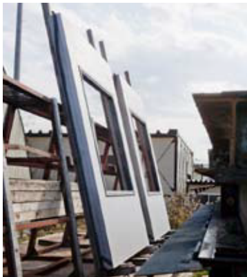
▲マンションの外壁。傷などつかないよう現場では細心の注意を払って製造されていました。