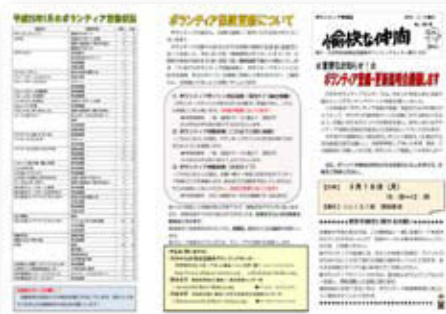
ボランティア情報紙「愉快的仲間」はりんくる、協働推進・市民の声を聴く課などにあります。