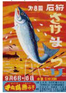
▲第8回(昭和38年)ポスター

狩鍋をはじめとするサケ料理が提供さ れました。これが石狩鍋が広く知られ るきっかけになりました。