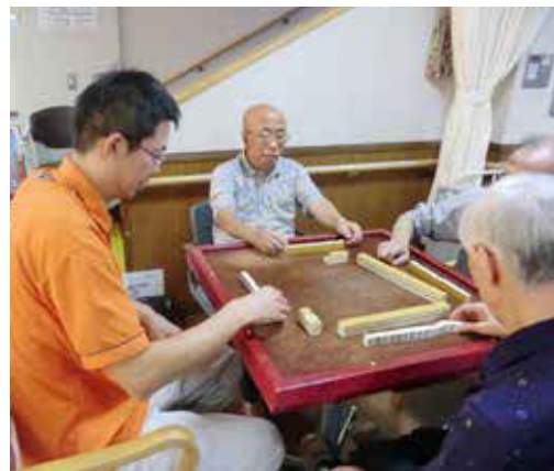
▲求められるボランティア活動は実にさまざまです。その最新情報は同センター発行の「愉快的仲間」に掲載されています(市役所、りんくろなど配布)。