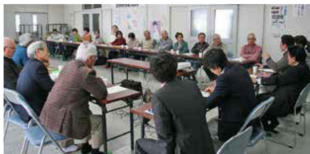
▲2/16(日)、花畔・緑苑台地区から28人の方が集まり開催。主に「地域見守りネットワーク」の仕組みや問題点について率直な意見が交わされました。(石狩中央会館にて)

昨年度は10会場で開催され、参加人数は延べ308人でした。町内会や地区社会福祉協議会の役員、民生委員・児童委員、高齢者クラブやボランティアで活動する方などが主な参加者です。個人でも気軽に参加できますので、ぜひ皆さんも一度、ご近所さんが集まる地域の懇談会をのぞいてみませんか？