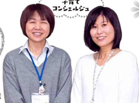
子育てコンシェルジュ