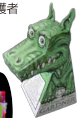
ドラゴンイリュージョン