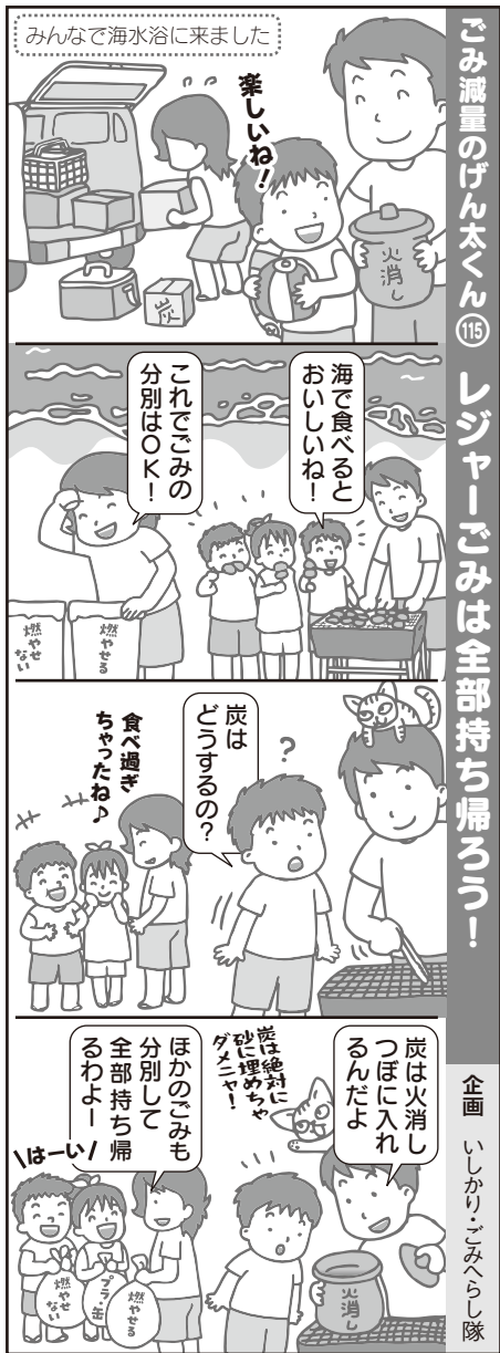
ごみ減量のげん太くん ①⑤ レジャーごみは全部持ち帰ろう!