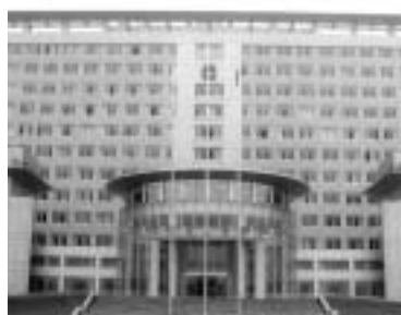
彭州市の発展を象徴する新市役所庁舎

農業研修生を受け入れたことから交流が始まった石狩市と 中国・彭州市。平成12年には姉妹都市提携を結び、5年目 を迎える今年、市長はじめ市民が彭州市を訪問しました。