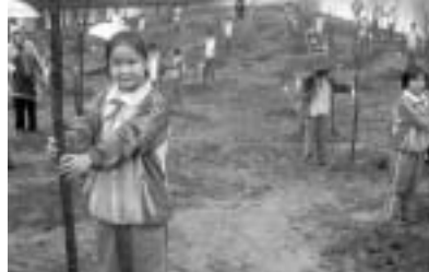
彭州園に桜を記念植樹

【彭州市】 所在地 中華人民共和国四川省 人口 約78万人 産業 農業(米、麦、野菜等) 工業(建築資材、化学、 食品加工、製薬等)