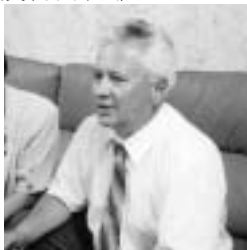
ムシャノビッチ・ワニノ市長