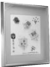
3市の代表により 作られた和風の ディスプレイ