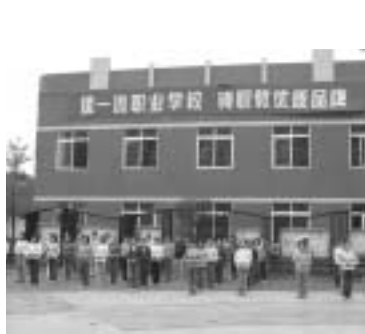
職業高等学校を訪問