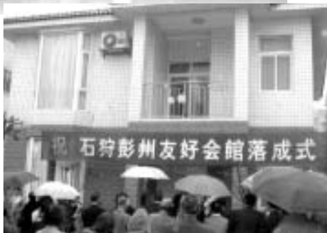
石狩彭州友好会館