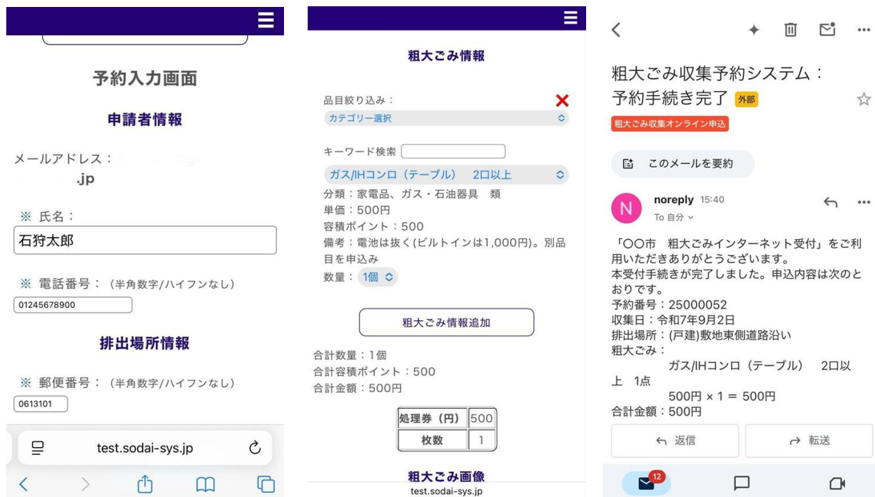
スマートフォンの予約画面のイメージ

これまで粗大ごみの申込みは、粗大ごみコールセンターにて平日（土日祝日を除く）のみ電話で受け付けていましたが、市民の利便性向上のため、令和7年10月から「粗大ごみインターネット受付システム」の運用を開始しました。システムの導入により、パソコンやスマートフォンから24時間いつでも申込みが可能となり、収集希望日をカレンダーで確認できるほか、品目や手数料も画面上で簡単に確認できるようになりました。