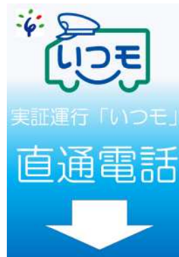
直通電話：石狩病院