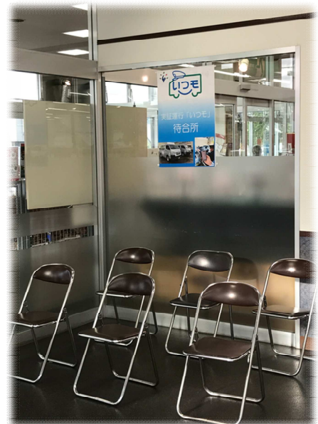
待合所：ラルズマート 花川南店