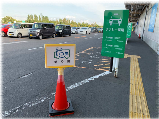
乗り場：イオンスーパーセンター 石狩緑苑台店