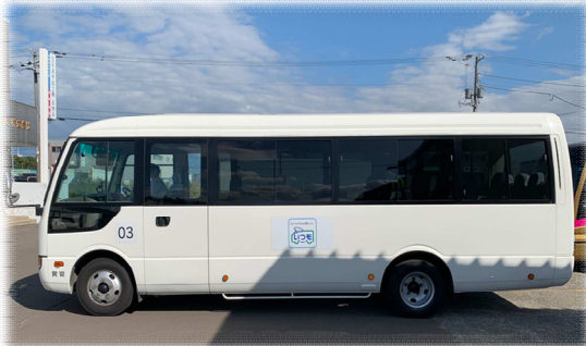
運行車両：マイクロバス