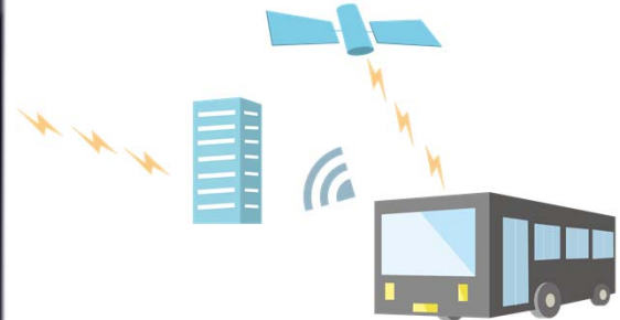
車両位置情報提供のイメージ