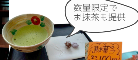
数量限定で お抹茶も提供