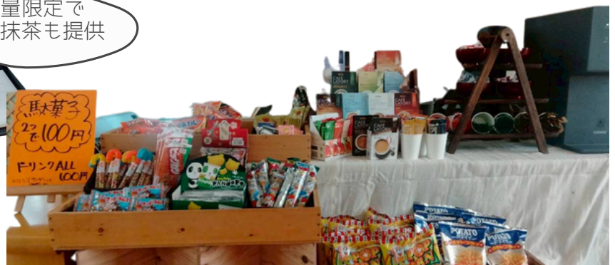
”喫茶きらり”では飲み物と駄菓子の販売