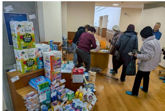
出張カフェクロ帰りに”キラスク”でお買い物