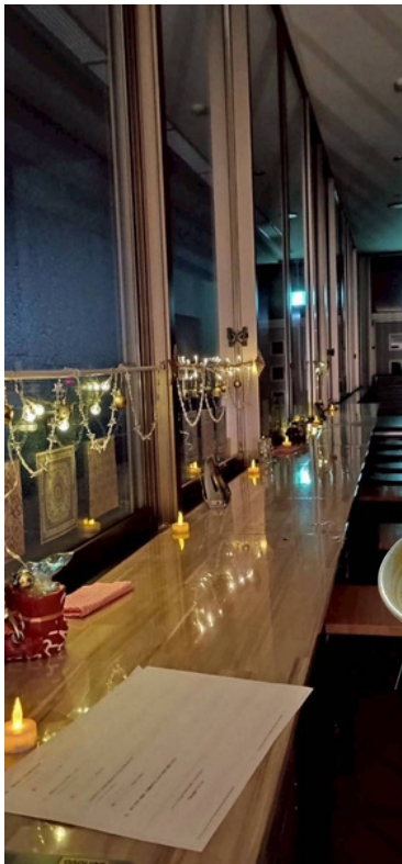
廊下に作ったカウンター席。 夜はめっちゃムードイイ！