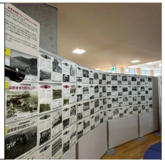
陣屋プロジェクト来場者数