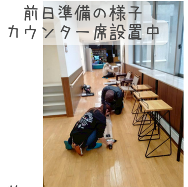
前日準備の様子 カウンター席設置中