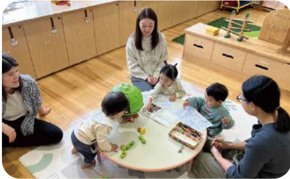
木の温もりに包まれた室内で遊ぶ子どもたち。気軽に来られる雰囲気、近所の方の利用も多い。

所 花川南4・3・2 認定こども園・ひかりのこいしかり内 ☎73-0773 日 毎週月・火・水曜10時～15時