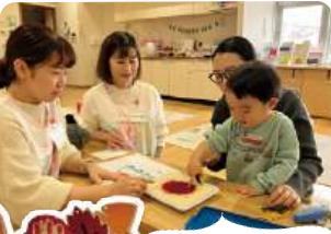
この日は手形を取って「もみじ作り」♪