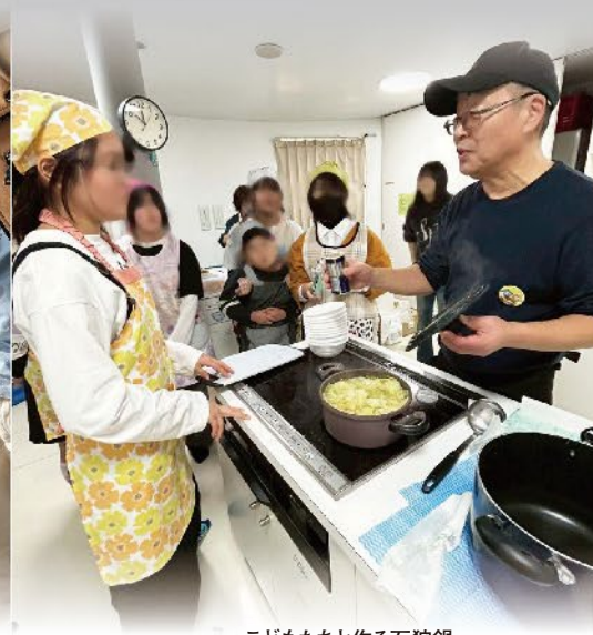
子どもたちと作る石狩鍋