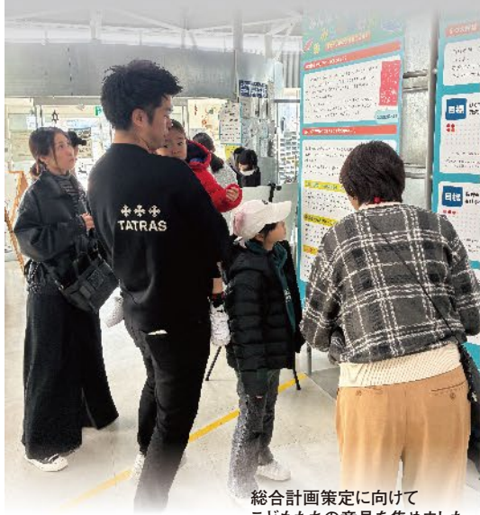
総合計画策定に向けて 子どもたちの意見を集めました