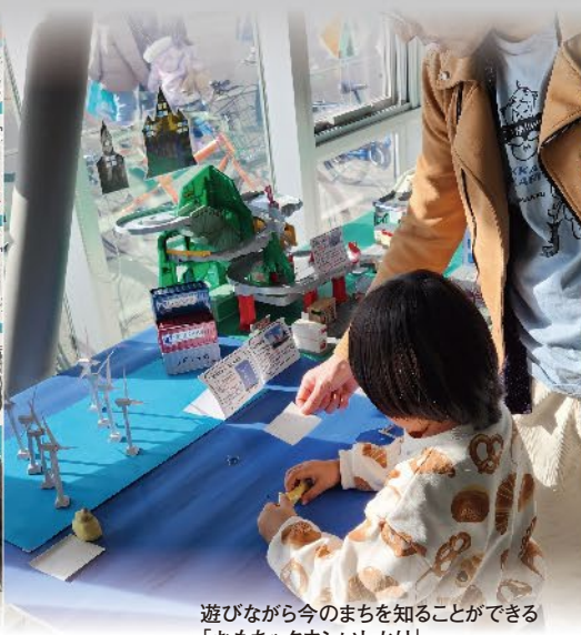
遊びながら今のまちを知ることができる 「おもちゃタウンいしかり」