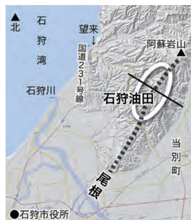
図2 石狩油田と尾根(地理院地図を使用)