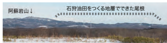
図4 国道231号線(聚富)から東側に見える尾根