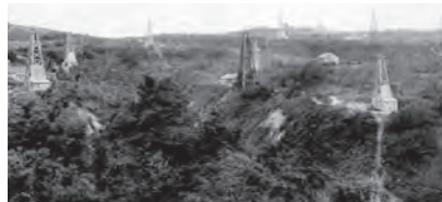
図1 最盛期の石狩油田(絵はがき「石狩八景」より)

石狩と厚田を結ぶ海沿いの国道231号線を通つたら、ちょうど山側を見てみましょう。そこに長く伸びている尾根(図4)。それが、地下の石狩油田の「ふた」なのです。(志賀健司)