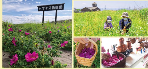
はまなすフェスティバル

ハマナスの花摘み体験、蒸留の実演、ワークショップ、クイズ、ハマナスを使ったお菓子やグッズの販売など、ハマナスを五感で満喫。