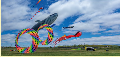
カイトフェスティバル

全長約 25mの巨大凧やスポーツカイトのデモフライト、「ぐにやぐにや凧」体験を行います。石狩のブランド豚「望来豚」を使った豚まん等の販売も!