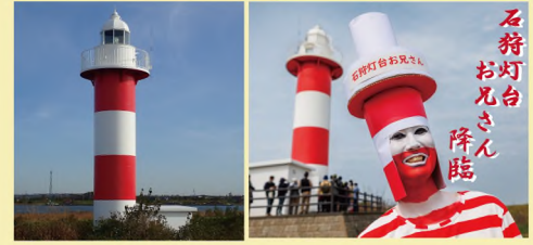
石狩灯台一般公開

普段みることができない灯台内部の一般公開を行います。最上階から望むはまなすの丘公園と日本海の織り成す景色は絶景です。安全のため小学生以上対象です。(入場無料) ※入替制のため受入人数に上限があります。