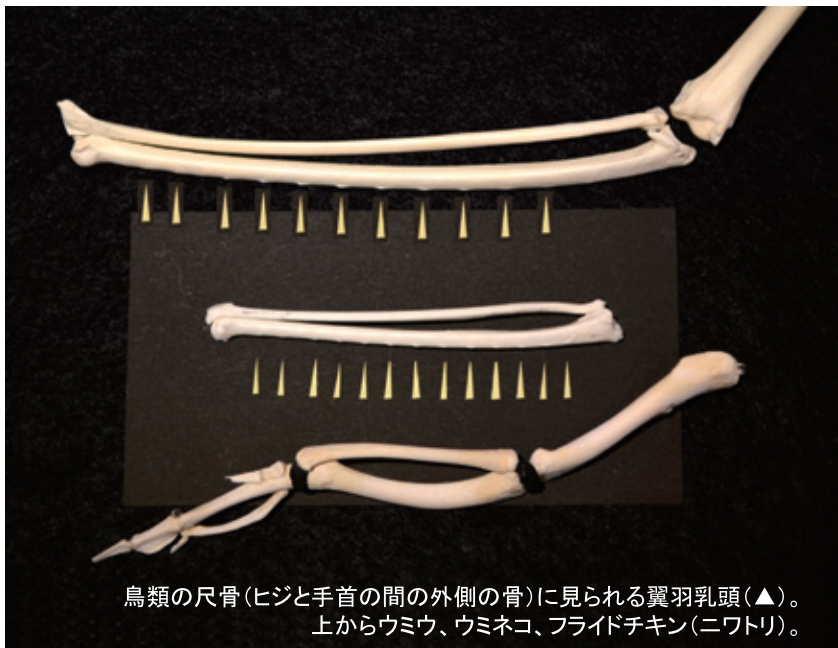
鳥類の尺骨(ヒジと手首の間の外側の骨)に見られる翼羽乳頭(▲)。上からウミウ、ウミネコ、フライドチキン(ニワトリ)。