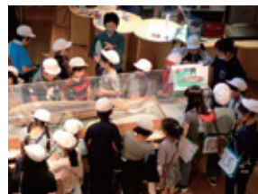
紅南小学校 3年生(6月30日) 資料館・旧長野商店の見学