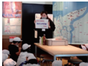
双葉小学校 5年生(6月12日) 石狩浜の漂着物と環境