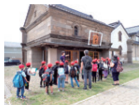
双葉小学校 3年生(6月22日) 資料館・旧長野商店の見学