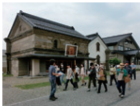
石狩市民図書館職員の研修(6月30日) 石狩本町地区を歩いて自然と歴史を学び、資料館の展示を見学