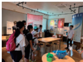
緑苑台小学校ポプラ学級(6月29日) 開拓使石狩缶詰所と鮭