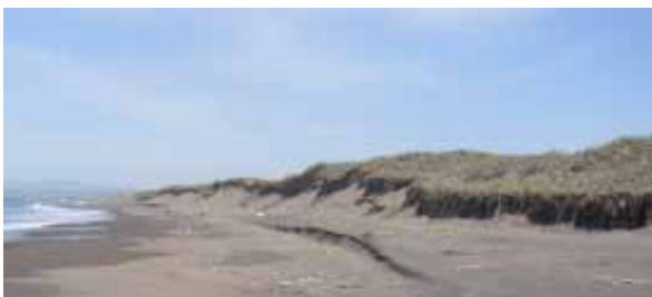
はまなすの丘海岸部の侵食状況

ここ数年、はまなすの丘の海岸部では、波による砂丘侵食が進んでいます。砂浜に沿って砂丘の断面が続き、砂丘を覆う海浜植物の根がむき出しになっています。6mほどあった砂丘の最高部はすでに侵食により無くなり、かつては砂丘の内陸側にあったハマナスやハマボウフウの群落も砂丘の最前線になっている箇所もあります。また、砂丘の高みがぼっかり窓が開いたように削られた箇所もあり、波が砂丘の内側まで入ってきた様子が伺えます。