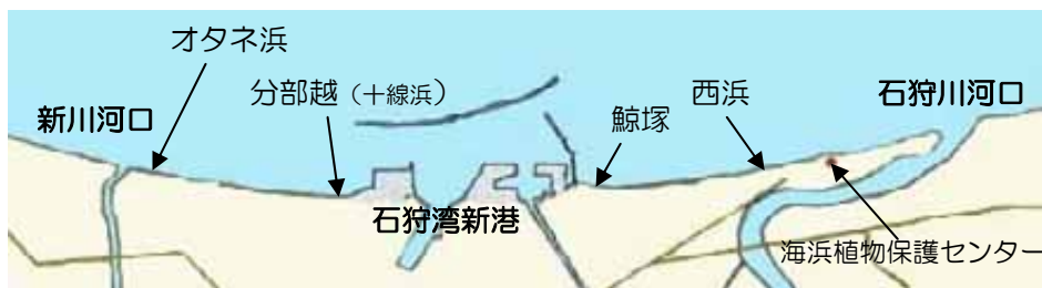
新川河口から石狩浜周辺の地名

6月末から7月にかけて3回ほど、住所表示でいうと銭函5丁目というあたりでしょうか、通称は十線浜というようですが、こちらへ観察に行ってきました。