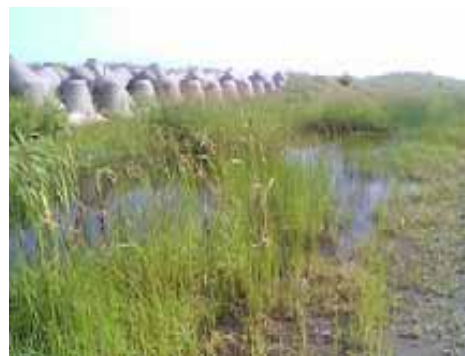
水生植物が茂る水たまり状の湿地

石狩湾新港樽川埠頭西側の工業団地から海方向へ、カシワ林の間を通る道を200mほど進むと、小高い砂丘の上に出ます。そこからは正面に、岸壁を作ろうとした跡のような四角いコンクリートの構築物が数百メートル先まで出来ていて、その内側に、淡水の大きい（100×200mくらいでしょうか）四角い池が広がっています。おそらく水深は1m以上はありそうです。その手前に、海岸に並行して車が通って踏み固められたような道筋があり、両側に水たまり状の湿地が点在します。水深もごく浅く、せいぜい50cmほどの水溜りが何か所もあり、水面の面積も、ゴルフ場のグリーンほどの広さからフェアウェイ面ほどの大きさくらいのものであります。