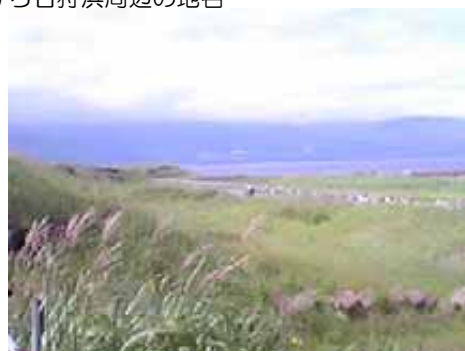
カシワ林の間の道を抜けて小高い砂丘の上から海を臨む

石狩町史に載っているアイヌ語地名という地図を見ると、こちらの浜は新川河口まで3キロほど続いていて、新川河口付近を「オタネ浜（オタナイ、ヲタルナイ）」、十線辺りを「フンベコイ（分部越）」、東ふ頭の根元辺りを「鯨塚」、石狩斎場辺りの海側を「西浜」と言うようです。フンベというのはアイヌ語でクジラを指す言葉で、ちなみにシャチのことを「カムイフンベ（神のクジラ）」といて他の魚を大量に連れてくるということで、アイヌの人々がおそれ敬い、感謝したそうです。