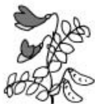
ハマエンドウ (マメ科)