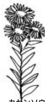
カセンソウ (キク科)