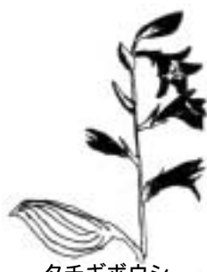
タチギボウシ (ユリ科)