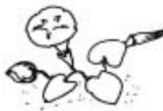
ハマヒルガオ (ヒルガオ科)