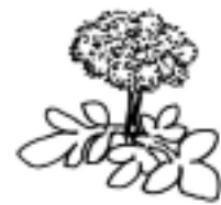
ハマボウフウ (セリ科)