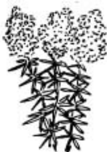
エゾカワラマツバ (アカネ科)