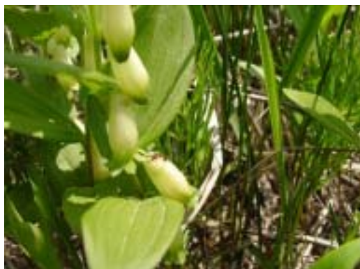
ヒメイズイの花。一番下の花にアリがいます。