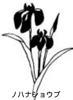
ハナショウブ (アヤメ科)