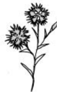
エゾカワラナデシコ (ナデシコ科)