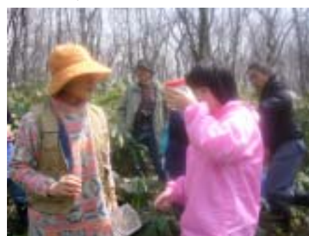
捕まえたキタハウネンエビを観察する参加者

しかし、融雪プールは、とても不安定な環境です。ある年は、あっという間に干上がってしまう年もあります。こういった年には、孵化したキタハウネンエビは成長途中で死んでしまいます。このような万が一の状況に備え、孵化しないまま翌年以降まで残っている卵もかなりの割合であるようです。長いものでは10年以上も卵のまままでいられるようです。