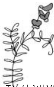
エゾノレンリソウ (マメ科)