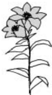
エゾスカシユリ (ユリ科)