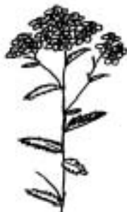
ノコギリソウ (キク科)