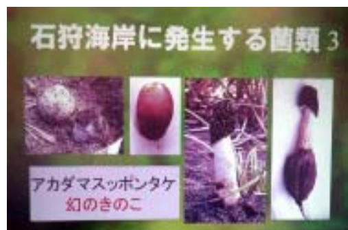
研修会のスライドの一部 (北方菌類フォーラム竹橋氏作成)

昨年秋、アカダマスツポndaケというキノコが石狩浜で発見されました。これは、日本で約60年ぶりの二例目の発見です。このキノコは、ハマニンニクやコウボウムギの根と共生している可能性が高く、海浜性キノコの生態に関する調査に、筑波大学とNPO法人北方菌類フォーラムが取り組むことになりました。当センターは、この調査へ協力依頼を受け、5月24日(水)ボランティアさん向けの研修会を開催しました。参加者5名と少なめでしたが、研修後の現地観察では、さっそくキノコを見つけた人もおり、中味の濃い研修でした。この調査に興味のある方、参加したい方は、お申し出下さい。