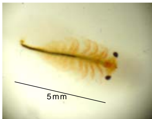
キタハウネンエビ（真上から撮影）

この浜砂堤列の地形は、大部分が農地、宅地開発で失われましたが、防風林として保護されてきた海岸林内には残っています。この残された浜砂堤列の凹地に、春先だけ雪解け水が溜まるのが、融雪プールで、そこにキタハウネンエビが棲んでいるのです。