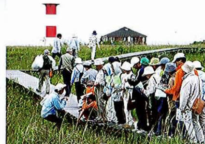
自然観察会(はまなすの丘公園で)

石狩浜海浜植物保護センターは、市民や研究機関と協働して、観察会や講座の開催、自然情報の収集と発信、モニタリング調査や植生回復試験などに取り組んでいます。