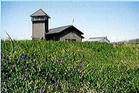
見本園からみた展示室とシンボル塔

石狩浜の成り立ち、石狩浜の生きもの、海浜植物の立体模型、動植物の写真などをパネルで紹介。リアルタイムの自然情報や、保護活動のようすも紹介しています。20名程度の小規模な研修室も兼ねています。