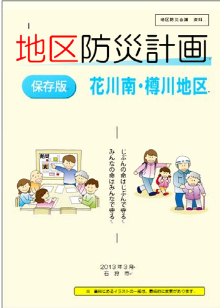
地区防災計画 本編