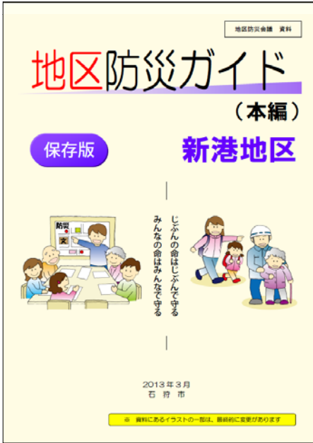
地区防災ガイド 本編