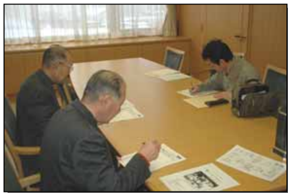
「座長はどなたにしましょうか？」グループ討議の様子