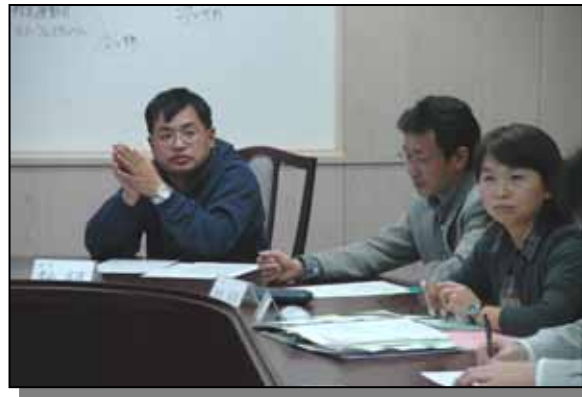
審議中の委員の様子

成17年11月24日、第3回 浜益区地域協議会が支所庁議室で開催され、地域づくり基金について全体で話し合われた後、スタートして間もない地域協議会の今後のあり方についてフリートキグ形式での意見交換が行われました。協議された内容等は、概ね次のとおりです。