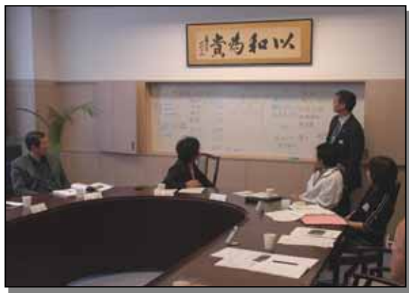
ちょっぴり白熱?したグループ分けの様子