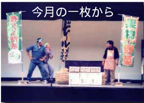
8/5 浜益小劇場定期公演 名場面『未来へ』～つながってくれてありがとう～より

久しぶりに海のあるまちでの勤務となりました。潮騒は落ち着きます。温泉・海の幸・独身生活を満喫しています。酒が進みます。温かい地域の皆さんと学校とが強くつながっていけるよう頑張りたいと思います。よろしく願いいたします。