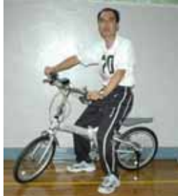
ジャンボ宝くじ1等賞当選者は「70番」!!

去る9月10日(日)、同実行委員会主催による浜益区民スポーツフェスティバルが浜益中学校を会場に、従来の村民運動会同様のイベント、地域自治区振興事業として開催されました。当日は生憎の雨により体育館での開催となりましたが、子どもから高齢者までおよそ100人の区民が集い、恒例のじゃんけん大会や初めてのアーチェリー体験、そして会場全体が1等賞品の「折りたたみ式自転車」の行方に固唾をのんだジャンボ宝くじなど楽しいスポーツフェスティバルとなりました。