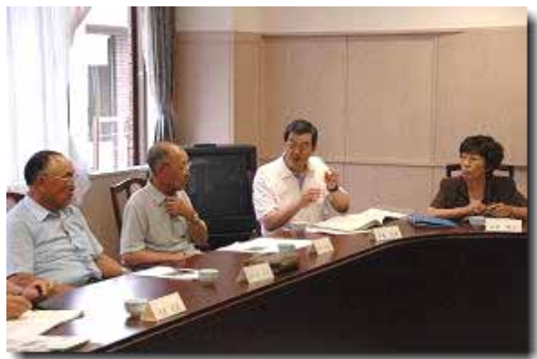
第4回浜益区地域協議会の様子

ていくこととしました。最後に、平成19年度の予算要求に向けた緊急のグループテーマや地域自治区振興事業の検討方法について協議し、9月中に再度、各グループの代表から構成する検討会議を開催することを確認しました。