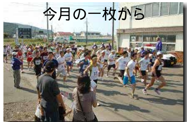
9/24 第1回浜益「いっぺ、かだれや」林道マラソンより 総勢88名、J A前を一齐にスタート!!