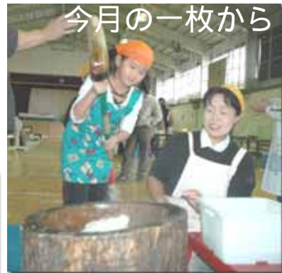
11/25 浜小もちつき大会より