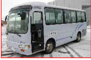
スクールバス2号 <特徴>29人乗りマイクロバス、淡い藤色のボディに青色のライン。

応募方法 お名前と車両 ~ の愛称(ニックネーム)、あれば理由も添えてご応募ください。特に決められた応募用紙はありません。電話でのご応募も可。