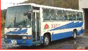
スクールバス1号 <特徴>37人乗り中型バス、白色に青色のライン、ハマナスの花の模様と「はまなす」の文字入り。

広く区民から親しまれ、活用されるよう「浜益スクールバス運行」「浜益滝川間乗合自動車運行」で使用するバス、ワゴン車の愛称(ニックネーム)を募集します。たくさんのご応募お待ちしております。