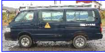
滝川浜益線ワゴン <特徴>9人乗りワゴン車(運転手除く)、濃紺のボディ。

応募方法 お名前と車両 ~ の愛称(ニックネーム)、あれば理由も添えてご応募ください。特に決められた応募用紙はありません。電話でのご応募も可。