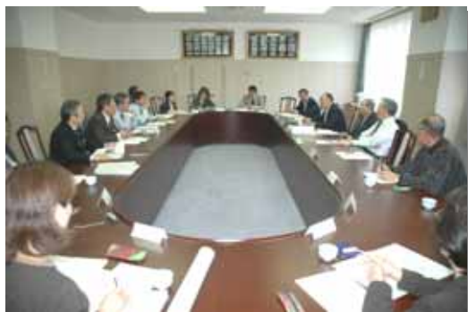
H19 第1回浜益区地域協議会の様子

平 成19年度第1回浜益区地域協議会は、4月25日(水)、10名の委員が出席し、支所庁議室で開催されました。地域自治区の円滑な運営を図るには、住民、地域協議会、支所間の連携が重要となることを鑑み、平成19年度の地域協議会から浜益支所内の各課長職にも地域協議会への出席を