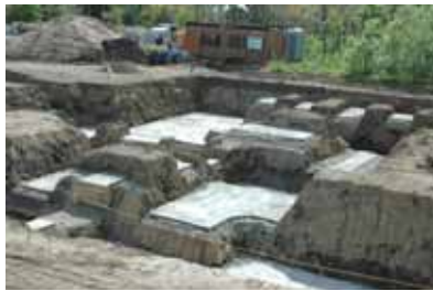
浜益斎場建設工事現場の様子 H19.5.24 撮影

[1 階] 告別ホール、待合ホール、控室、火葬炉室、 トイレ(男・女・多目的)、給湯室、玄関ホール など [2 階] 前室、排風機室