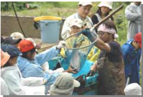
60cm超級のニジマスの引っ越し作業を体験