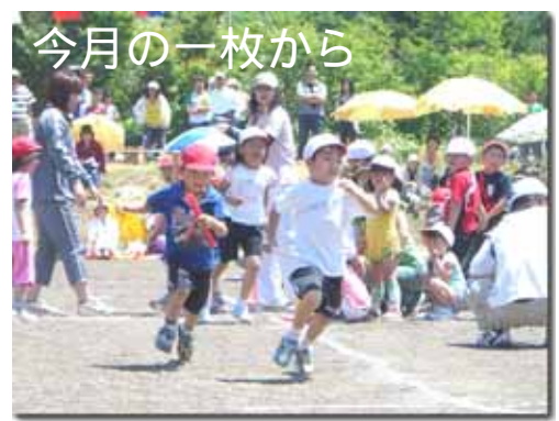
今月の一枚から 6/17 はまます保育園運動会より... プログラムも大詰め。白熱の紅白リレー、勝敗の行方は?