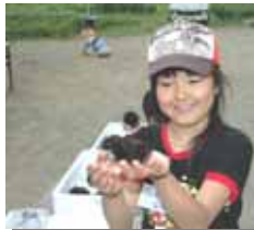
初めて?の生ウニに感激!!