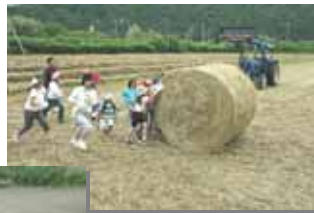
ダイナミックに乾牧草のロール転がしを体験

自然豊かな農山漁村地域において、その自然、文化、人々との交流を楽しみながら、ゆとりある休暇を過ごす滞在型の余暇活動のことで、農林水産生産活動や農水畜産物をなかだちとした人的な交流を主体としたものを指します。