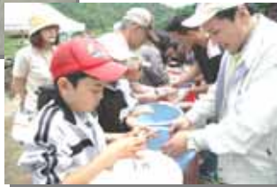
初めて?のヤマベの捌き

「浜地協だより」は、地域協議会で話し合われた事柄や活動内容をみなさんにお伝えするため、定期的に発行していきます。