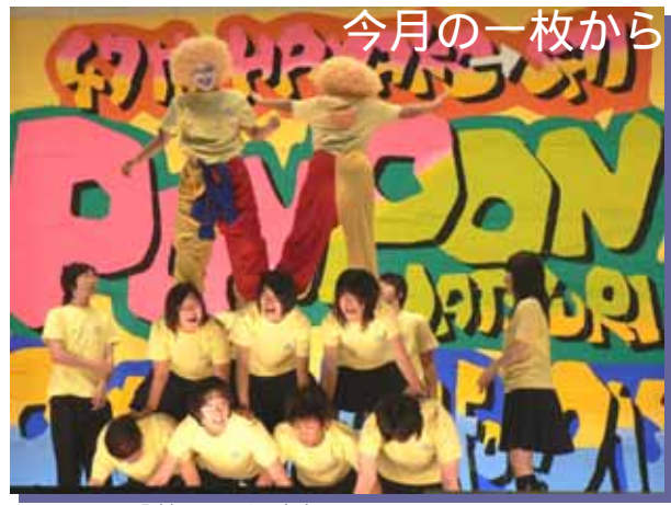
7/20「第47回浜高祭」オープニングセレモニーから... テーマに沿って自らがデザインした揃いのTシャツを組み体操でお披露目。

【支所市民福祉課からのお知らせ】8月は道市民税普通徴収第2期、国民健康保険第3期、介護保険料普通徴収第3期の納期です。忘れずに納期内に納めましょう。