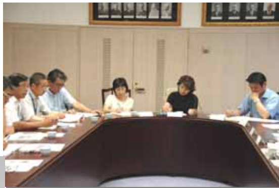
H19 第2回浜益区地域協議会の様子

浜益区民スポーツフェスティバル事業の開催経費の財源の一部には「浜益地域づくり基金」が充てられています。