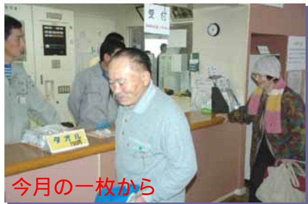
今月の一枚から 12/13 浜益温泉の再オープンより... 「いやあ、待った。待った。2ヵ月ぶりの温泉だ!!」 ... [大変ご迷惑をおかけしました。(詫)]

くは正月行事として「歳神(としがみ)」を迎える祭りがあり、門松を立てて鏡餅を供えていたが、その供えた餅をお下がりとして子供達に食べさせ、「御歳魂(おとしたま)」と呼ばれたことからする説と、この餅は年初に分配されたことから年の初めの賜物(たまもの)で「年賜(としたま)」が変化したとする説と、鏡餅が丸いことから「お年玉」になったとする説があり、いずれも歳神に由来します。 お年玉が金品を贈る言葉として用いられた例は、室町時代から見え始め、当時は茶碗や扇など様々な物が贈り物として用いられたとされています。 現代では、「お年玉」として餅を与えたとしても子供達が喜ぶとは到底考えづらいです。浜益区の地域振興のため、皆さんの声を遠慮なく、最寄りの委員や事務局にお届けください。この浜益区は地域みんなの手で創り上げていきましょう。