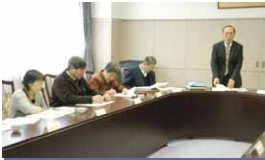
第7回浜益区地域協議会の様子

【とき】H19.12.19(水)13:30～15:20 【ところ】支所 庁議室 【委員】<出席>9名 <欠席>6名 【傍聴】0名 【主な議題】 新たな委員の紹介 [報告] H20 地域自治区振興事業について [報告] 公共施設の有効活用について [継続]