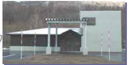
石狩市火葬場利用料