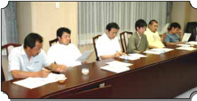
8/7 浜益地区の活性化を考える連携会議の様子

【9月イベントのお知らせ】【14日】浜益区民「サマー」夏祭り～浜中G。【21日】浜益ふるさと祭り～海浜公園。【28日】浜益「いっぺ、かたれや」林道W&M～浜中G。他