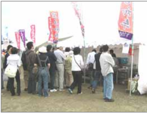
8/23~24「石狩まるごとフェスタ2008」より ...浜益牛の販売ブースに長蛇の列が...

浜益区の地域振興のため、皆さんの声をご遠慮なく、最寄りの委員や事務局にお届けください。この浜益区は地域みんなの手で創り上げていきたいと思います。