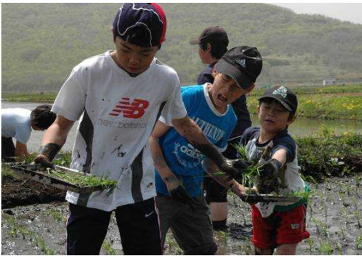
5/19 浜益小学校田植え活動

【浜益支所市民生活課からのお知らせ】6月は道市民税普通徴収第1期、国民健康保険税第1期、介護保険料第1期の納期です。忘れずに納期内に納めましょう。