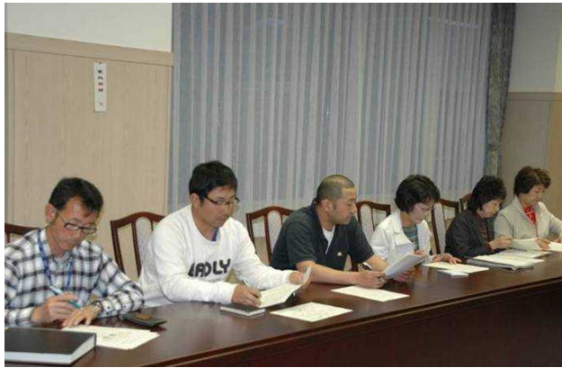
5/27 はまます井戸端倶楽部連携会議

[6月イベントのお知らせ] [7日] 浜益ふるさと市場 第11回浜益小学校運動会。 [12日] ふれあいタウンミーティング。 [21日] はまます保育園運動会