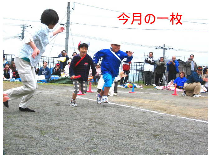
6/21 はまます保育園運動会 紅白リレー 見ているお母さん(?)も身を乗り出すほどの激走です。