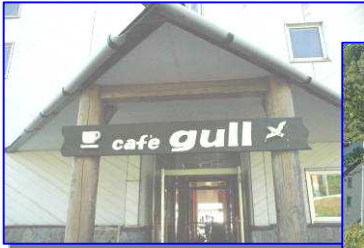
看板にはかもめが。