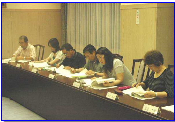
第3回地域協議会の様子

前回会議で委員一同から、浜益の基幹産業である一次産業の振興及び観光産業との連携については最重要の課題として取り組むべきであるとの意見を受け、「地域の自立促進の基本方針」の文言を修正したほか、自立促進施策区分に基づいた個別の事業内容の説明を受けました。