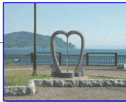
ラバースオーシャン。