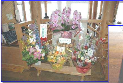
たくさんのお花を頂きました。