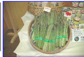
朝採りアスパラも販売。