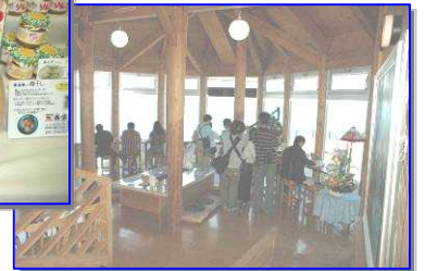
NHKの取材も受けました。

このたび「カフェ・ガル」のオープンに際し、たくさんのお客様にご来店いただき、心より厚くお礼申し上げます。まだまだ手探り状態ですが、浜益の活性化のために少しでもお役に立てるようメンバー一同ががんばりますので、よろしくお祈りいたします。ご来店お待ちしております。