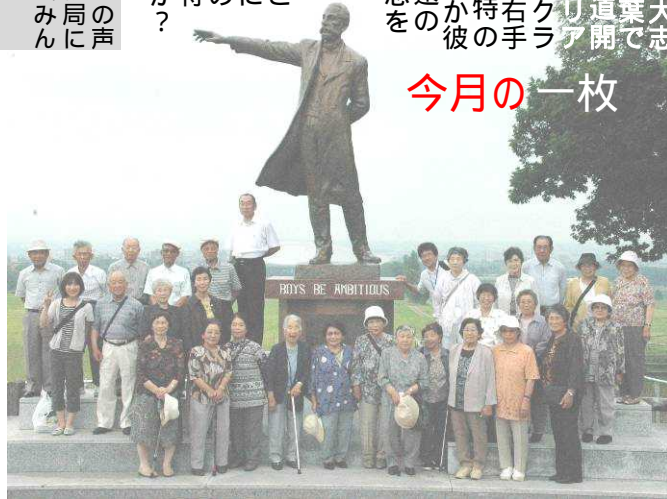
7/1 生きがいがづくり学園・社会見学クラーク博士像をバックに記念の1枚