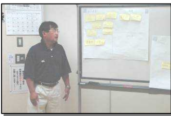
書き出された意見をもとに発表

、事業があり、それらが個別に あるのではなく、地域住民がそ れらを「まとめて」考えていく 必要がある。 「浜益の物語」をつくってほ しい。様々な事業を物語に含め て展開していくことを考える ことがこれからの地域づくり には大切。 地域づくりの方向性について 出された意見等をもとに、次 回(10月以降予定)の研修会で 更に議論し、地域づくりの方向 性についてまとめを行います。