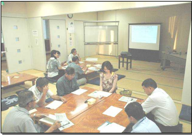
グループでの話し合いの様子

本年度の浜益区地域協議会 で行う「地域づくり研修会(全 3回)」。2回目は「浜益区の未 来を考える」をテーマにワーク ショップを行いました。 ワークショップは元々、「仕 事場」、「作業場」など、共同で 何かを作る場所の意味ですが 近年はまちづくりの計画や、公 共施設整備計画の策定手法とし