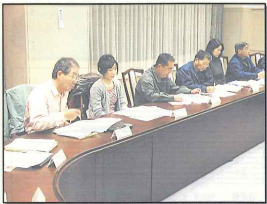
▲ 第7回地域協議会のようす

平成23年度予算要求に向け、支所地域振興課から提出のあった地域自治区振興事業について協議を行いました。 本年度実施した5事業全てが継続事業として提案され、各事業ごとの実施効果や実績を基に検討を行いました。 このうち、「水稻育苗兼施設野菜等ハウス整備事業」については、施設野菜として作付した