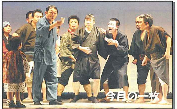
▲11/7 石狩市民文化祭浜益会場より 浜益小劇場「お人好し侍～余命一週間の侍～」

今年も残すところあと一か月となり、冬型の気圧配置により11月末にかけて日本海側を中心に大荒れの天気となり、越波による通行止めや強風による停電などに影響を及ぼしました。厳しい寒さや雪が待ち受けるこの季節は積雪や凍結により路面が滑りやすくなり、交通事故が発生する恐れがあります。事故のない楽しい年末を迎えられるよう、一人ひとりが一層安全運転と交通安全を心がけましょう。 ※浜益区の地域振興のため、皆さんの声をご遠慮なく、最寄りの委員や事務局にお届けください。この浜益区は地域みんなの手で創り上げていきたいと思います。