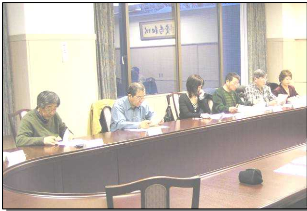
第10回地域協議会のようす

「浜地協だより」は、地域協議会で話し合われた事柄や活動内容をみなさんにお伝えするため、定期的に発行していきます。