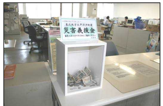
市民生活課に設置された募金箱

お問い合わせ 浜益支所地域振興課 79-2111 市社会福祉協議会浜益支所 79-5050