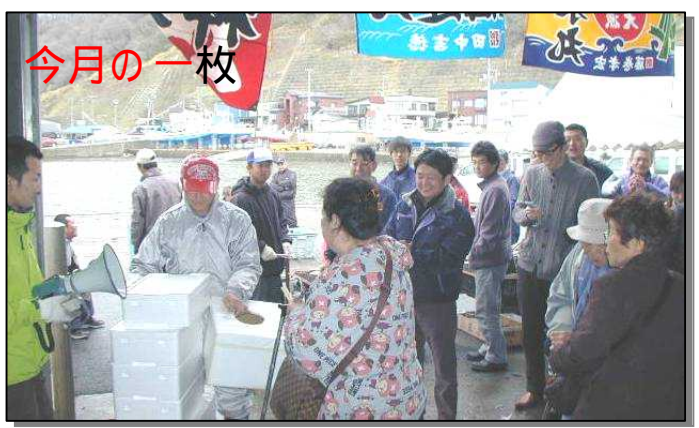
4/24 浜益ふるさと市場(朝市) 豪華海の幸詰め合わせが当たる抽選会も開催!