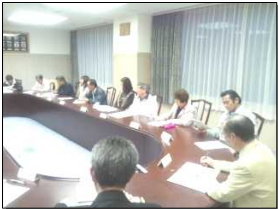
第1回地域協議会の様子

「浜地協だより」は、地域協議会で話し合われた事柄や活動内容をみなさんにお伝えするため、定期的に発行していきます。