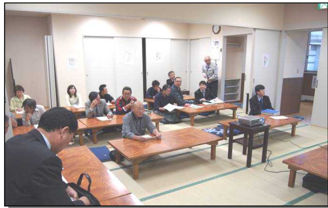
5/25 意見交換会の様子

問 担い手支援であれば、家賃3万円は高いのではないかと？ 答 家賃の上限を設定したが、指定管理者が市の承認を得て、それ以下にすることが可能。もう少し安くするのではないかと考えている。 問 希望者多数の場合は？ 答 多数の場合は抽選となる。 問 農業者、漁業者が入居する住宅を、それぞれの団体が指定管理者となるのか？ 答 3戸をまとめて指定管理することとなる。 問 住宅の修繕費用は？ 答 小規模修繕は指定管理者が行う。 問 (住宅への入居開始が11月からの説明だが)もう少し早く入居できないか？ 答 改修工事の環境検査等があるため難しいが、できるだけ早く入居できるよう努める。 問 農業者と漁業者が入居した場合、どちらかの団体が指定管理者で対応が可能か？