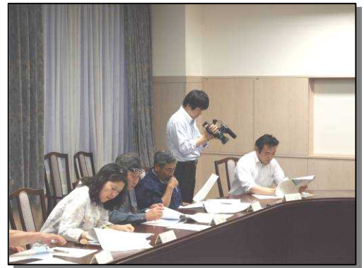
第3回地域協議会の様子が翌日朝のNHKニュース「おはよう北海道」で紹介されました。