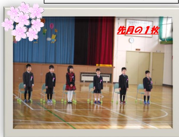
↑ 浜益小学校新1年生入学式 (4/6)