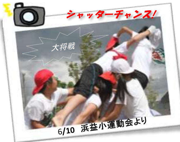
6/10 浜益小運動会より