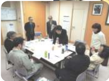
グループ討議の様子(1/22浜益支所)