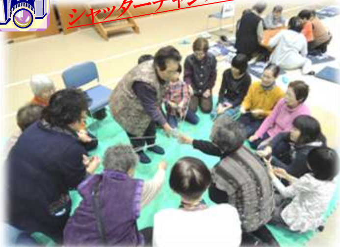
「冬の遊び」宝引きに夢になる参加者(1/9・きらり・支所主催)