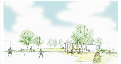
▲のびのび多目的広場イメージスケッチ