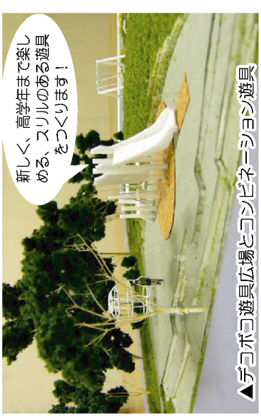
▲デコボコ遊具広場とコンビネーション遊具