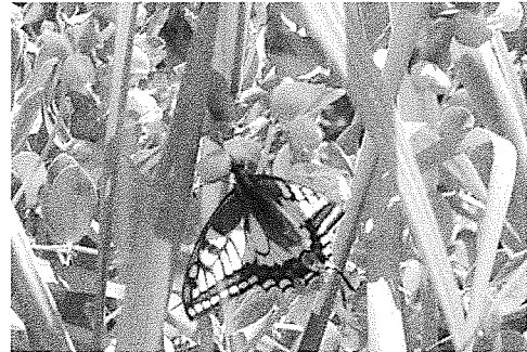
ハマエンドウの花から蜜を吸うアゲハチョウ